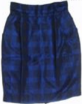
Saia Tafet Xadrez Azul- R$ 350