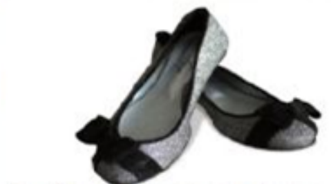
Sapatilha com glitter e Laço em Camurça R$ 106