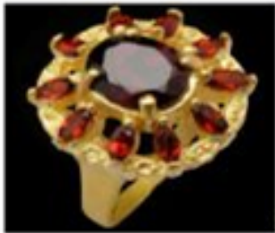
Anel Mamoushka - R$ 190